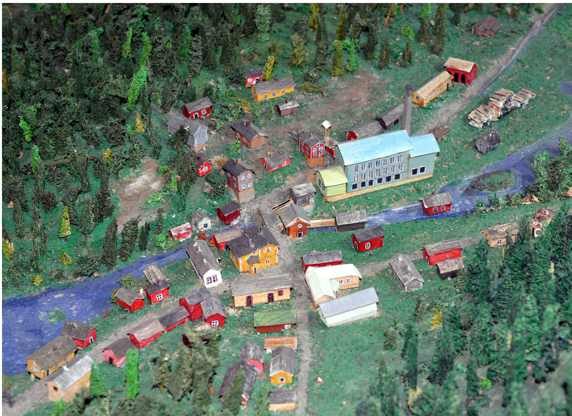
Osa kirkonkylän pienoismallia Kosken Verkatehtaan ja Teuronjoen ylittävä sillan kohdalta.

Kosken kirkonkylää 1900-luvun alussa esittelevä pienoismalli on siirtymässä Hämeenkosken koululla tehtävien muutostöiden johdosta Seuralaan. Pienoismalli on elinkaarikunnostuksen tarpeessa ja sen esittelytila on suunniteltava ja rakennettava uuteen tilaan, joiden kustannuksiin haetaan ulkopuolista rahoitusta muun muassa Suomen Kulttuurirahastolta. Koski-seura pitää tärkeänä, että malli tulee jatkossa olemaan yleisön nähtävillä ja esiteltävissä riittävässä laajuudessa.