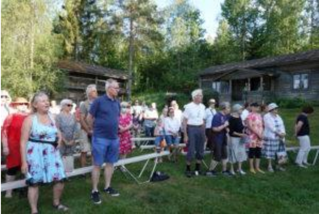
Hämeenkosken mieskuoron konsertti Musiikkia Lukkarin jalanjäljillä päättyi yhteisesti laulettuun Hämäläisten lauluun.