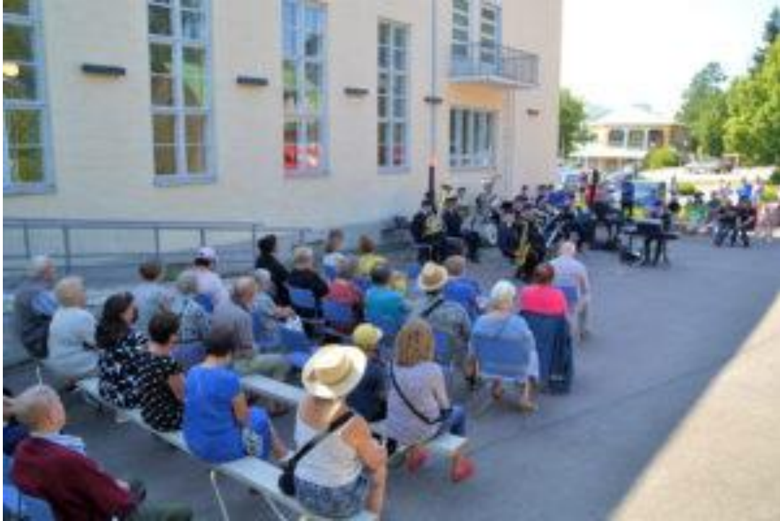
Osa yli satapäisestä yleisöstä löysi suojaa helteeltä Seuralan varjosta seuratessaan Kosken VPK:n viihdeorkesterin konserttia VPK:n juhlaviikon päättäneessä tilaisuudessa.